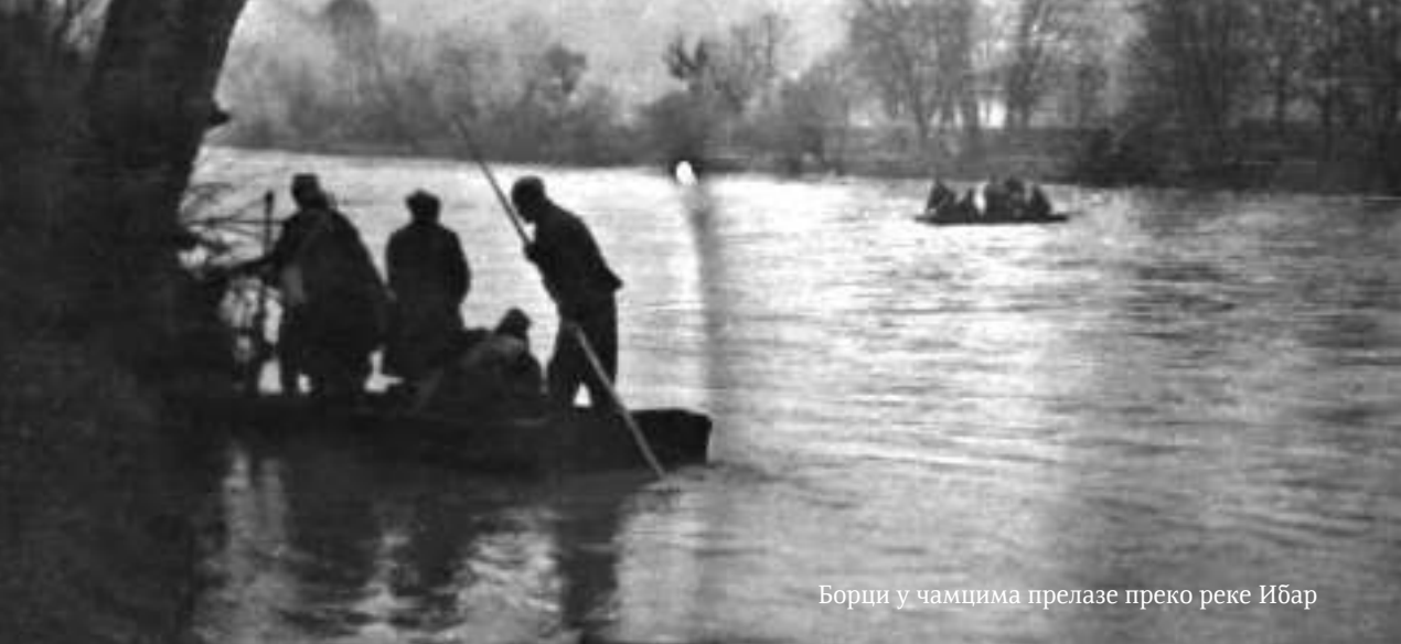
Борци у чамцима прелазе преко реке Ибар