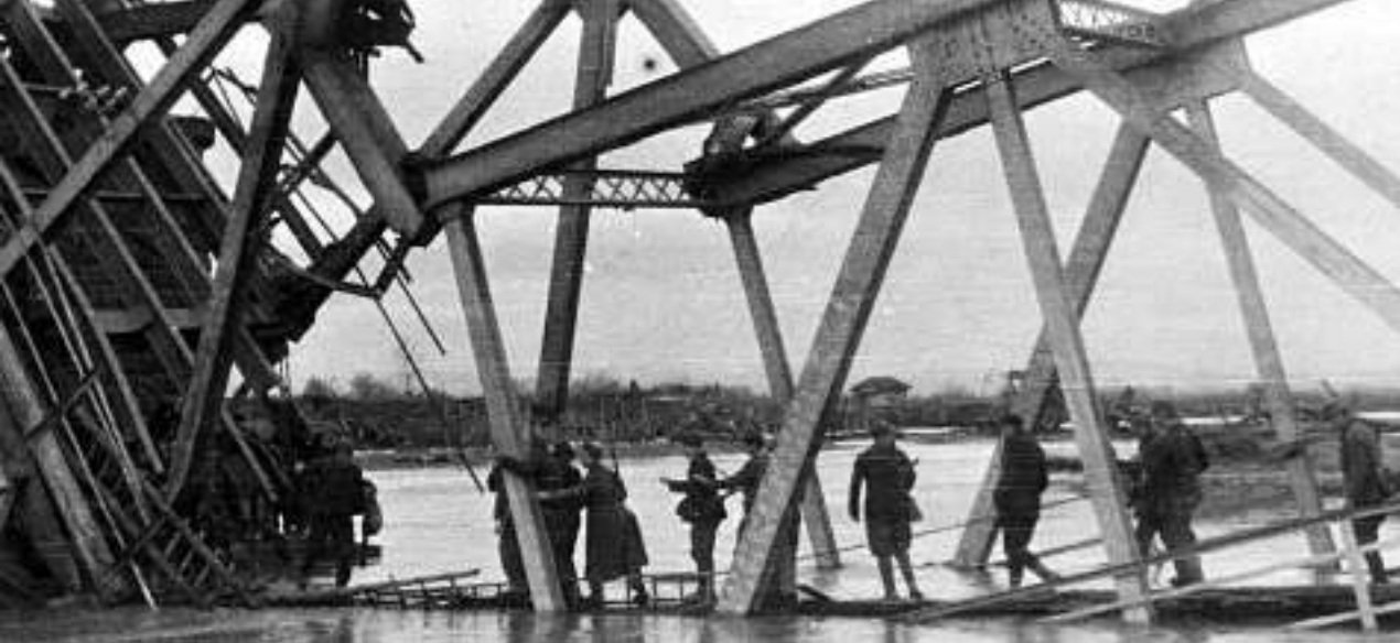
Партизанске јединице на срушеном мосту на Ибру

одступницу својим снагама које су се повлачиле из Крагујевца. Током 26. октобра јединице III српске бригаде извршиле напад на линији фронта Витановац–Шумарице–Велика Борча–Мала Борча. Успех је остварен једино заузимањем Мале Борче.