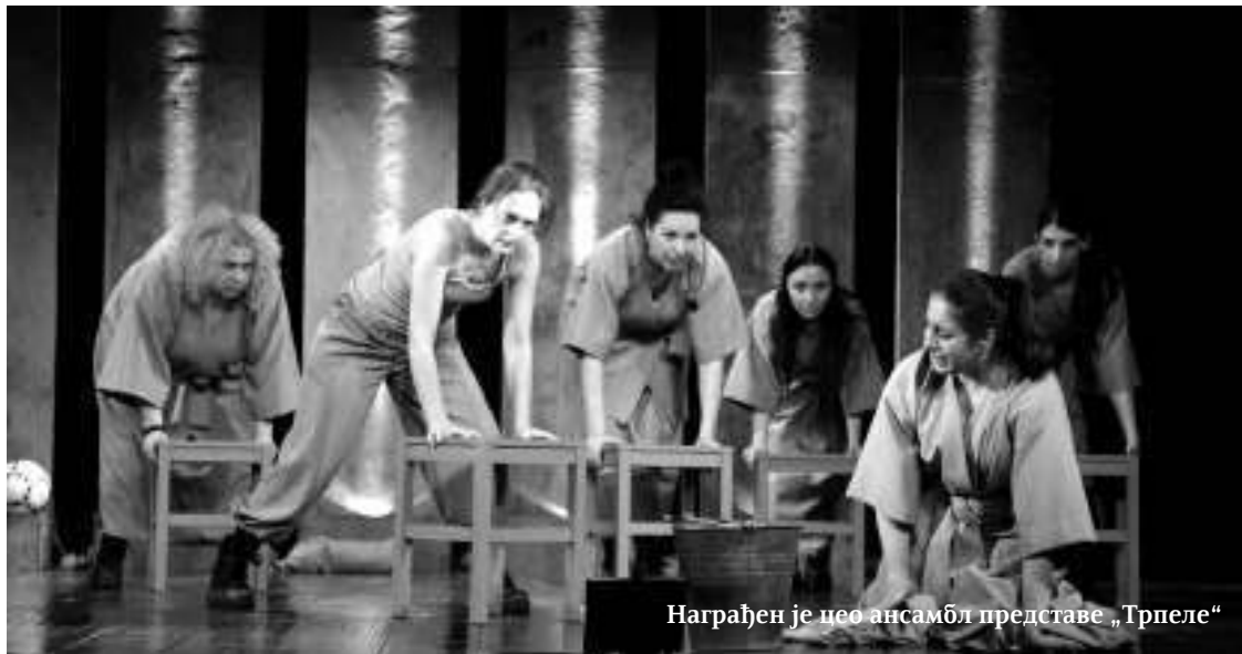
Награђен је цео ансамбл представе „Трпеле“