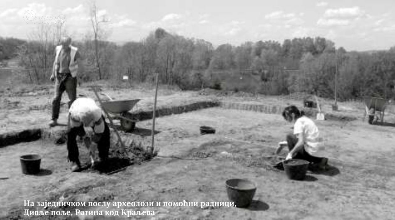
На заједничком послу археолози и помоћни радници, Дивље поље, Ратина код Краљева

– Не. Да би једна заједница имала писмо, потребно је да сазри потреба за писмом. Да бисмо нешто назвали писменим потребно је да се у више случајева јавља на једном локалитету, да се у истој форми јавља и на другом. На винчанској керамици постоје неки урези, који могу бити обележаваће количине или неке трампе, али то не можемо назвати писмом. Прича о винчанском писму је неоснована. Винчанска култура је толико високо развијена и толико квалитетна да јој не треба додавати ништа што није имала.